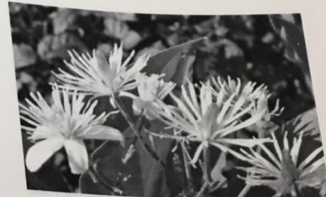
FIGURA 2. Clematis.

Wild Oat: Dudas ante el camino correcto en la vida. Wild Rose: Designación, apatía. Willow: Amor, compasión, resentimiento. Rescue Remedy: formulada por Star, Mimulus, Clematis, Rock Rose, Impatiens. **