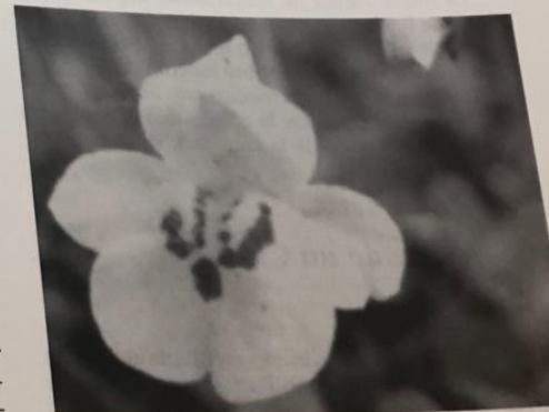
FIGURA 3. Mimulus.

En otras ocasiones, sin embargo, los problemas de comportamiento son el reflejo de una alteración orgánica. El hecho de que algunos de dichos proble-