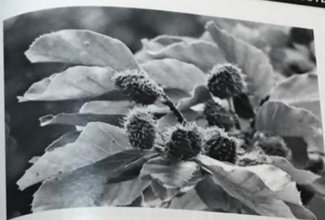
FIGURA 1. Beech.