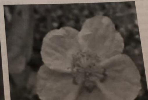
FIGURA 4. Rose.